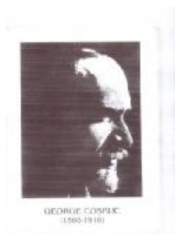
„Povestea găștelor” „La oglindă” „Cântec”