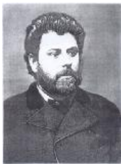
„Povesti” „Povestiri” „Amintiri din copilărie”

La sfârșitul activității didactice, pe tablă erau astfel ordonate, materiale și idei: