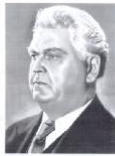
„Dumbrava minunată” „Domnu' Trandafir”

Portretele scriitorilor și poezilor au fost așezate din pauză. Fiecare a fost abordat cu responsabilitate, stimulând interesul copilului în prezent, dar și în perspectivă.