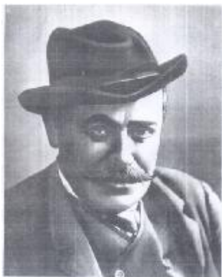
I. L. CARAGIALE

„Cartea cu jucării” „Zdreanță” „Zece mâțe”